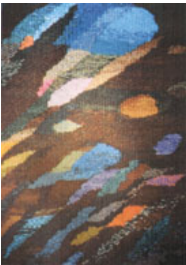
„Dryfowanie” - gobelin, len