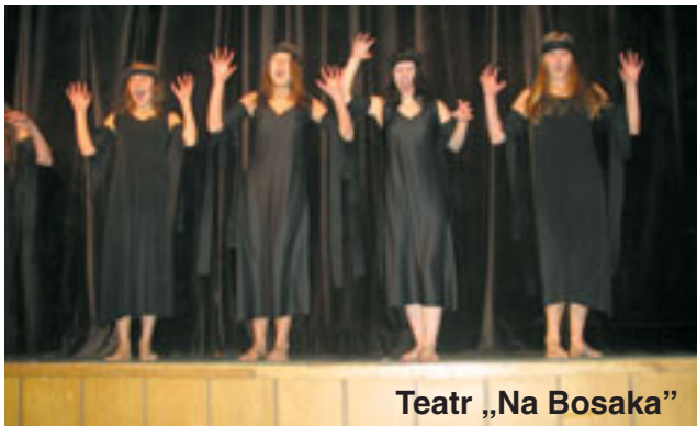
Teatr „Na Bosaka”

min ferii zimowych, teatry miały szansę zaprezentować się na scenie Domu Kultury „Świt” już po tradycyjnym okresie kolędowym.