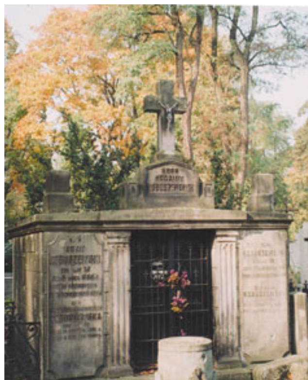
Grobowiec rodziny Kobuszewskich,

Pomnik wystawiła „stroskana żona z dziećmi”. Kwaterna 5-A